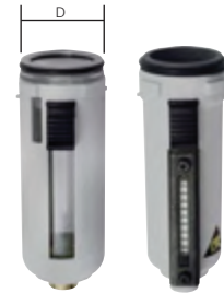
Typ BOL 1 F Typ BOM 1 F